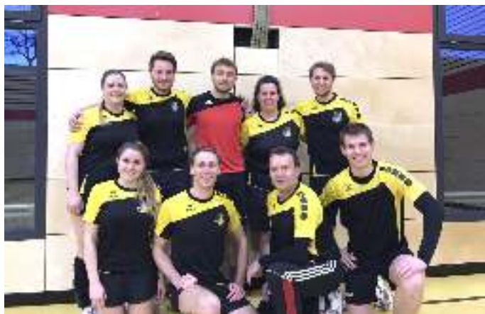
Mannschaft Ottenhofen 1

Mit 4 Siegen aus den ersten 5 Spielen wurde man dieser Favoritenrolle dann auch gerecht. Die Span-