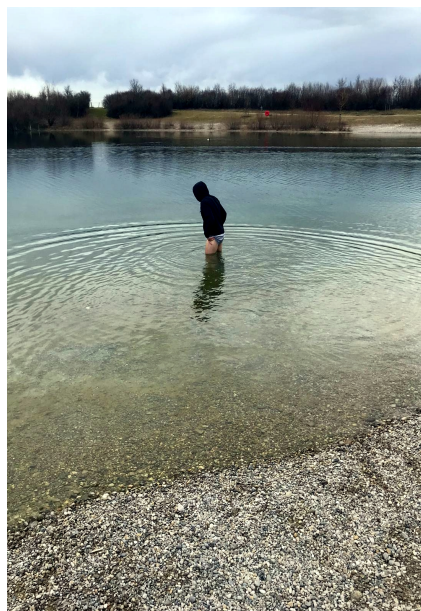
Nach dem Spiel ist vor dem Spiel. Da hilft oft nur ein Eisbad.

Vorbereitungseinheiten gerade mal auf 1/4 des Pensums. Deshalb trainierten beide Mannschaften meist gemeinsam und versuchten das Beste aus der Situation herauszuholen. Auch die Platzverhältnisse verschlechterten sich Woche für Woche, hauptsächlich aufgrund des schlechten Wetters.