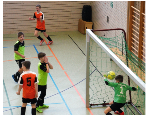
Tor gegen Ramsau!

Da in diesem Turnier Jeder gegen Jeden spielte gab es keine Finalsspiele. Somit gewann unsere Mannschaft verdient dieses D1-Turnier.