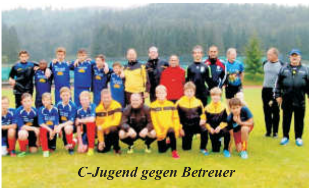
C-Jugend gegen Betreuer

Und diese Erfolgsserie setzte sich fort: Beim Grenzlandturnier mit insgesamt 13 teilnehmenden Mannschaften wurde der 2. Platz erreicht, bei den Turnieren in Walpertskirchen und beim Heimturnier in Ottenhofen wurde der Siegerpokal jeweils an unsere Mannschaft übergeben. Der 2. Platz beim DJK-Turnier in Ramsau bildete den Abschluß dieser denkwürdigen Saison.