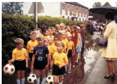
Der 64er Jahrgang auf dem Weg zur Sportheimeinweihung 1971