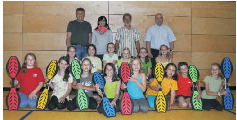
Die Spenden unserer Sponsoren sorgen für neuen Schwung im Kinderturnen