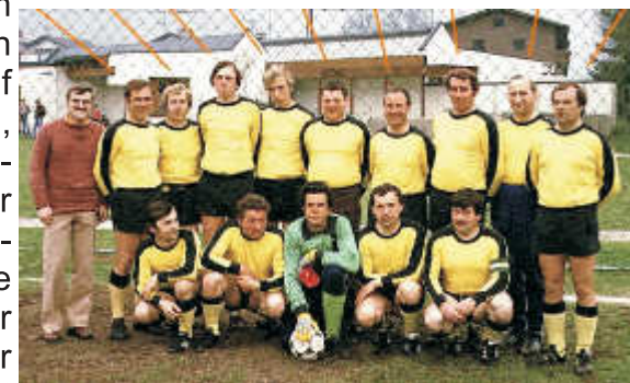
DJK-AH am 03.05.1980